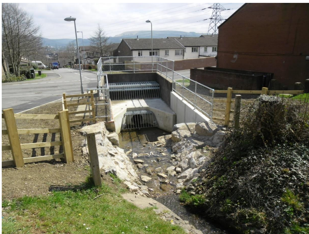
Delwedd o un o'r pyllau gwanhau a adeiladwyd fel rhan o Gynllun Lliniaru Llifogydd Rhydfelen