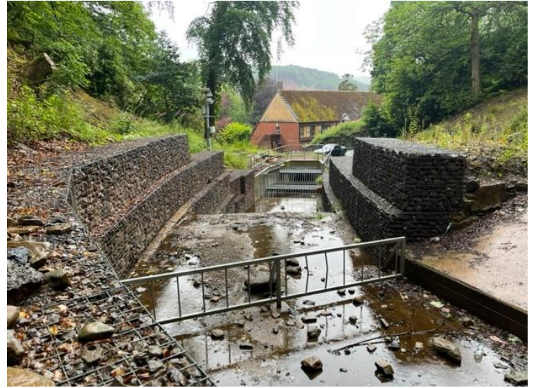
Lluniau cyn (chwith) ac Ar ôl (dde) o fewnfa Cynllun Lliniaru Llifogydd Heol Pentre