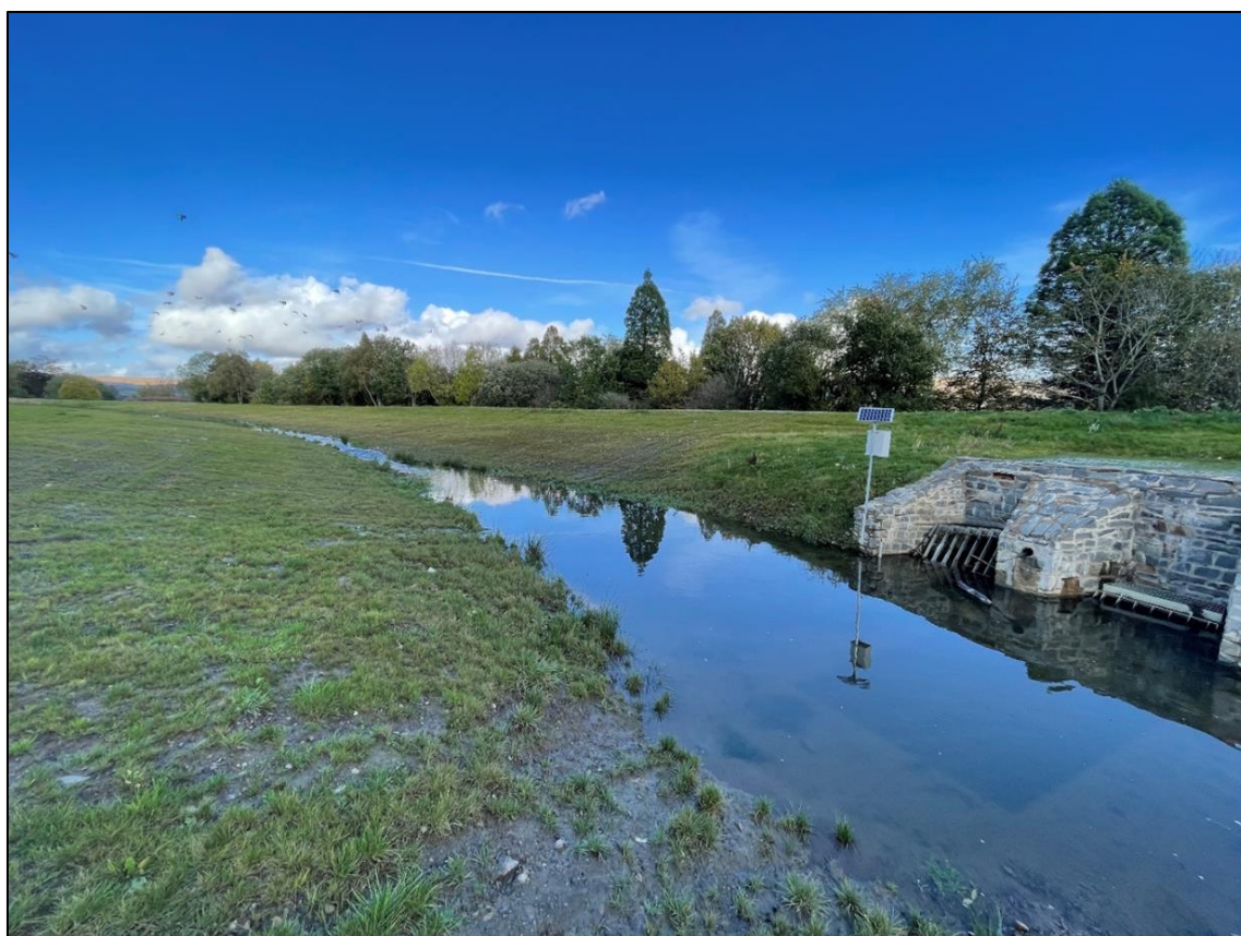
Pwll Gwanhau – Cynllun Lliniaru Llifogydd Lôn y Parc, Aberdâr