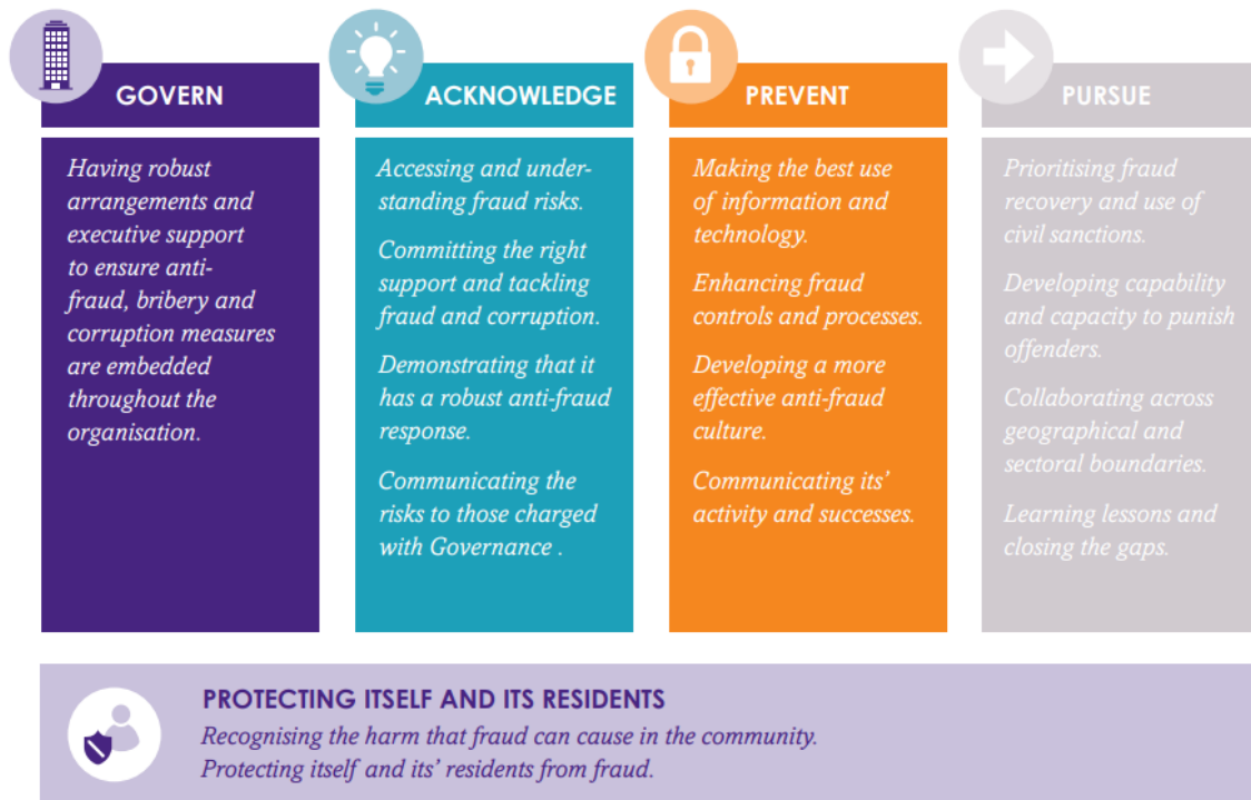
Ffigur 1: Egwyddorion lefel uchel Atal Twyll Llywodraeth Leol wedi'u diweddarau: